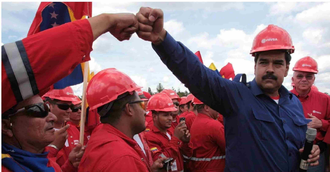
► Nicolás Maduro en un acto de la compañía estatal Petróleos de Venezuela S.A.

Tiraje: 78.224 Lectoría: 253.149 Favorabilidad: No Definida