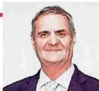
Por Uwe Rohwedder. Decano Facultad de Arquitectura, U.Central.