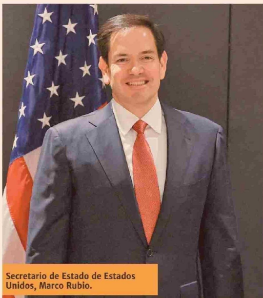
Secretario de Estado de Estados Unidos, Marco Rubio.

Título: Se concreta primer diálogo entre canciller de Chile y su par de Estados Unidos, Marco Rubio