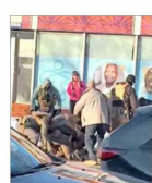
Antes de disparar, los oficiales golpearon a la persona fallecida.

El lado B de usar Ozempic sin supervisión | A14