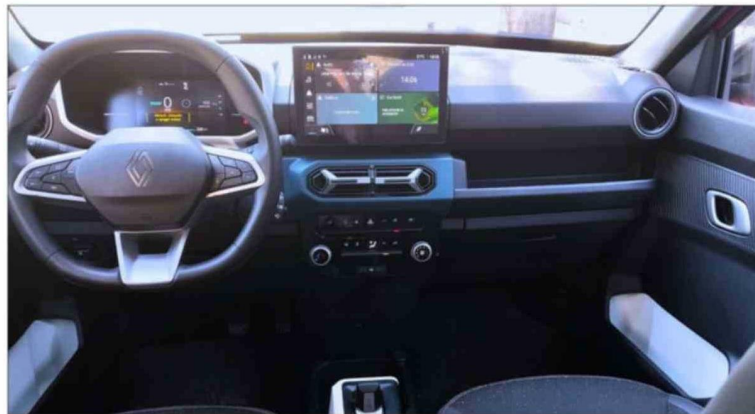
Renault New Kwid e-Tech frente a algunos de sus competidores

El tablero digital es sobrio, de 7 pulgadas, con información sobre cada vez que se supera el límite de velocidad. Cuenta con una pantalla táctil de 10,1", que hace de interfaz principal tanto para las calibraciones del auto, como para los de sus sistemas de confort y entre-