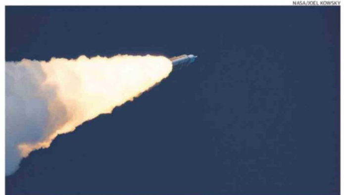
ESTÁ ENCARGADO DE QUE LA ESTRUCTURA PRIMARIA Y SECUNDARIA PUEDAN SOPORTAR TODAS LAS CARGAS.