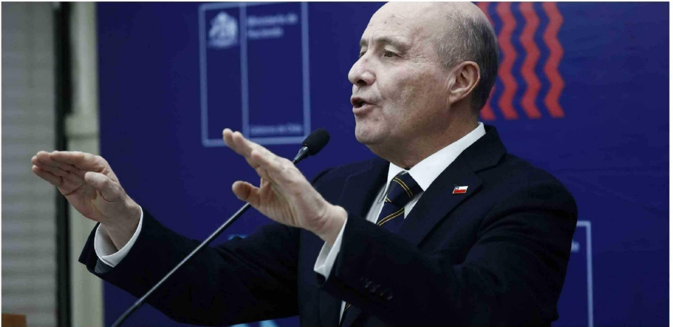
► Jorge Quiroz, ministro de Hacienda.