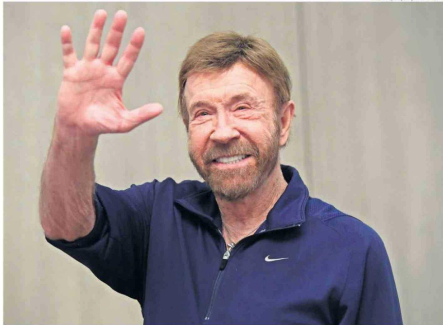
EL ACTOR FUE INTERNADO REPENTINAMENTE EN UN CENTRO MÉDICO EN HÁWAI. EL 10 DE MARZO HABÍA CELEBRADO SU CUMPLEAÑOS.

"Probé gimnasia y fútbol americano en la preparatoria North Torrance", le contó a The Associated