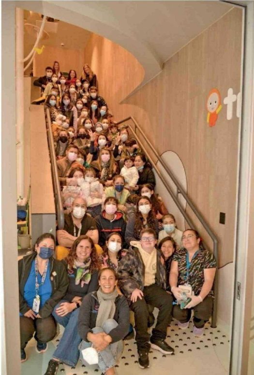
© Foto de todos los niños y niñas que son atendidos en TROI Araucanía y el equipo del Hospital Dr. Hernán Henríquez Aravena.