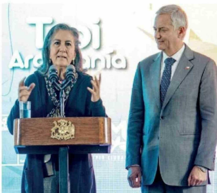
© Ministra de Salud Dra. May Chomali y el Presidente de la República, José Antonio Kast durante la ceremonia.