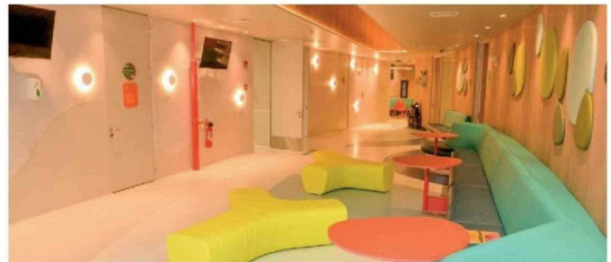
© Muestra espacio de sala de segundo piso.