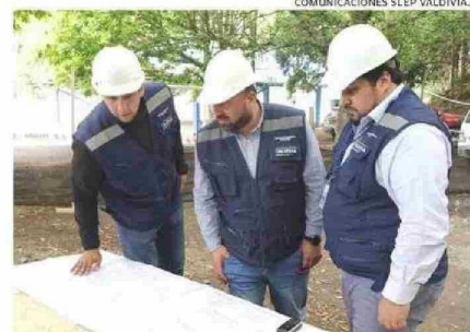
COMUNICACIONES SLEP VALDIVIA.

tos de la provincia de Valdivia pertenecientes al Servicio Local. Para ello, la inversión ejecutada durante el periodo, desde enero hasta la primera semana de diciembre, para la atención de los distintos requerimientos solicitados por los establecimientos educativos, asciende a un monto aproximado de $1.700 millones. <3