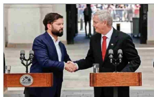
El Presidente en ejercicio, Gabriel Boric, y el electo, José Antonio Kast, analizaron la emergencia, que modificó la agenda de la transición.

■ Afecciones respiratorias y oculares, junto con estrés posttraumático, asoman como los principales riesgos para salud de los afectados.