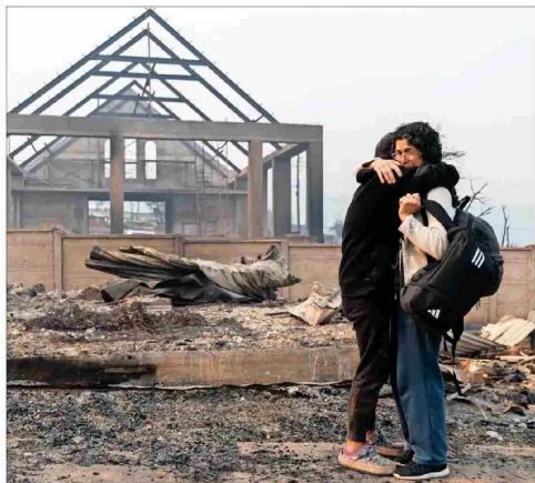
Una madre y su hijo se abrazan en la devastada localidad de Tomé. Nueve incendios seguan activos ayer en Biobío.

■ En La Moneda, el actual Gobierno y el próximo coordinan reuniones para abordar tareas como la reconstrucción de los sectores arrasados y la atención de los damnificados.