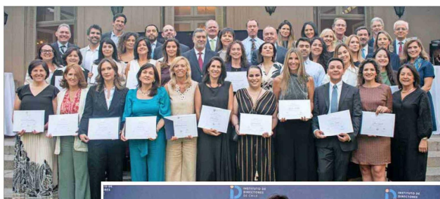
Graduados de los programas Certificación Internacional de Directores de Empresas y Diploma in Company Direction, conducentes a la distinción Chartered Director.

Paralelamente, el Teatro Zócc fue el escenario de las graduaciones de los programas Directorios Efectivos, Actualización para Directores de Empresas, Empresas Familiares, ESG y Board Mentoring, iniciativas que responden a los desafíos actuales de gobernanza, sostenibilidad y liderazgo.