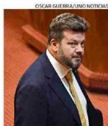
El diputado Johannes Kaiser.