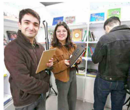
En su permanencia en la Plaza de Armas, subieron varios jóvenes para conocer en detalle este nuevo transporte y revisar los libros que tendrá a disposición para incentivar la lectura.