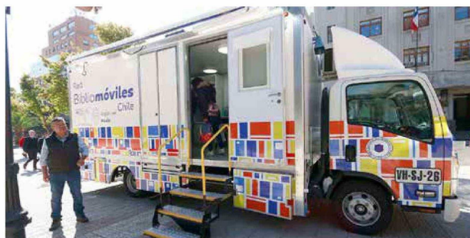
Hasta la Plaza de Armas de la capital regional llegó la nueva y moderna Bibliomóvil que recorrerá las diversas comunas del Maule para incentivar la lectura en pequeños y adultos.

fiel reflejo de que a través de esto podemos conocer nuevos mundos y a través de la escritura... podemos aprender y relacionarnos de mejor forma". Letelier, en tanto, recalcó que "nuestro ministerio tiene un propósito muy claro que es... fomentar el desarrollo y la lectura a nivel inicial. Tenemos una tasa preocupante de alfabetismo en nuestra región, de más de 40.000 personas, por lo tanto, para nosotros es