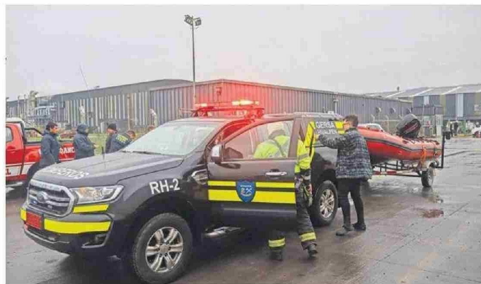
El Grupo especializado de Bomberos para búsquedas subacuáticas se sumó al operativo en San Pedro.

millas, es decir, cerca de 16 km es la distancia entre la Caleta Alto del Rey con la ubicación del bote sin tripulación