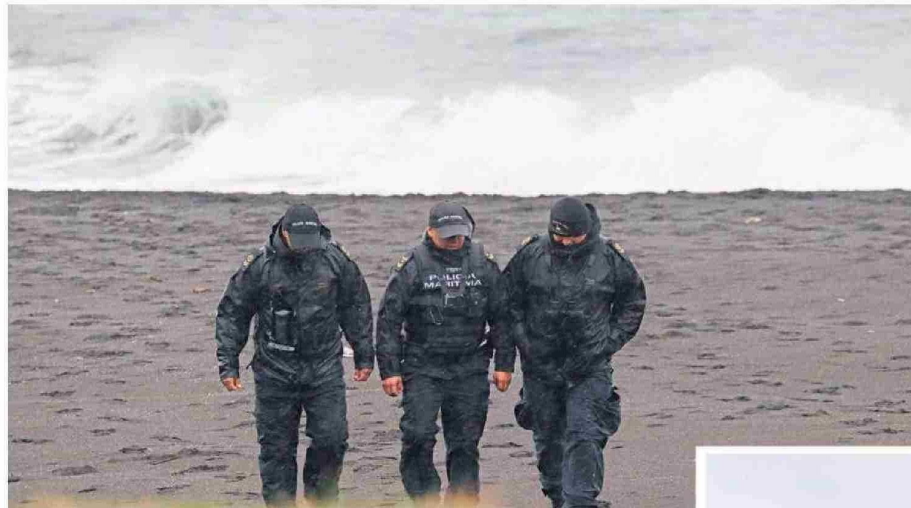
La Armada dirigió la búsqueda.