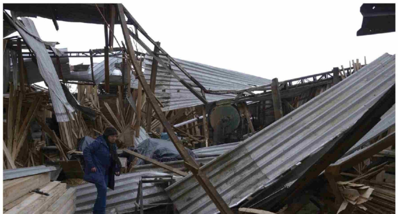
EL COLAPSO DEL SISTEMA ELÉCTRICO, la interrupción de avenidas y daños en viviendas fueron las consecuencias más visibles del tornado que cruzó sectores urbanos de Los Ángeles en 2019.