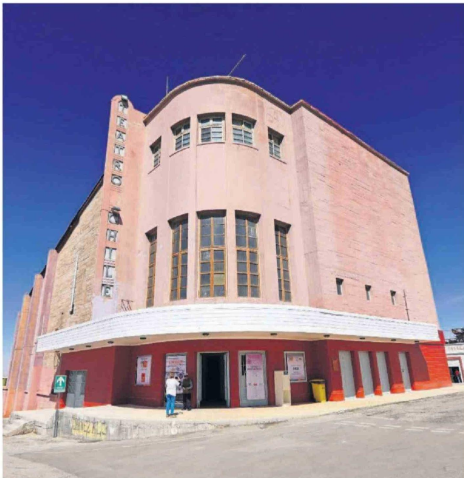
TEATRO CHILE, UNO DE LOS EDIFICIOS MÁS EMBLEMÁTICOS QUE SE ENCUENTRA EMPLAZADO AL INTERIOR DEL CAMPAMENTO DE CHUQUICAMATA.