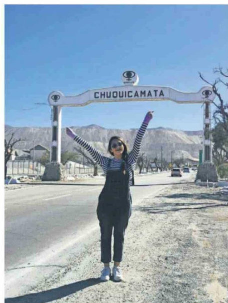
CHUQUICAMATINA TOMÁNDOSE LA TRADICIONAL FOTOGRAFÍA FRENTE AL ARCO DE BIENVENIDA DEL CAMPAMENTO.

Por lo anterior, agregó que "hemos impulsado la recuperación de espacios emblemáticos como el Teatro Chile, el Club Chuqui, la Parroquia El Salvador, el Auditorio Sindical y recientemente el Club Obrero, bajo los lineamientos del Consejo de Monumentos Nacionales. Pero además, creemos que este desafío debe construirse de manera colectiva, por eso seguimos trabajando junto a agrupaciones de ex habitantes y organizaciones patrimoniales para avanzar en una futura Corporación Patrimonial y Cultural Chuquicamata que permita fortalecer su conservación, difusión y desarrollo cultural en el tiempo".