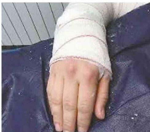
EL FUNCIONARIO TERMINÓ CON SU BRAZO DERECHO FRACTURADO.

funcionario en la presentación de la denuncia correspondiente ante Carabineros y activamos de inmediato los protocolos necesarios para garantizar su atención médica”, señaló el comunicado oficial emitido por la Municipalidad de Papudo.