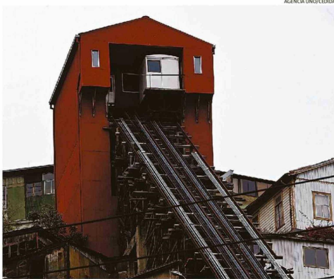
EL MINISTRO ASEGURÓ QUE ESTÁN TRABAJANDO PARA MEJORAR LA SITUACIÓN DE LOS ASCENSORES.

En esa línea, el ministro reconoce que “los ascensores de Valparaíso son primordiales, entendemos que lamentablemente no todos funcionan, desde el 2025 se viene señalando que se van a arreglar, que va a venir un reglamento, estamos trabajando en forma silenciosa porque creemos que a Valparaíso se le ha sobre prometido muchas veces y no se le ha podido cumplir”.