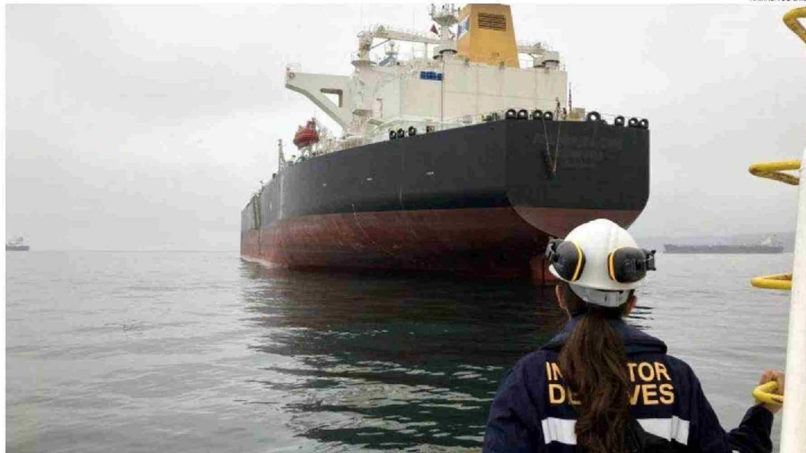
DE ACUERDO AL DIPUTADO ALEJANDRO BERNALDES, DEL PARTIDO LIBERAL, SÓLO EXISTEN 14 INSPECTORES NAVALES PARA ATENDER LOS REQUERIMIENTOS DE MÁS DE MIL NAVES.

En cuanto al impacto de mantener un buque detenido a la espera de esta inspección naval, el ejecutivo de Armasur es-