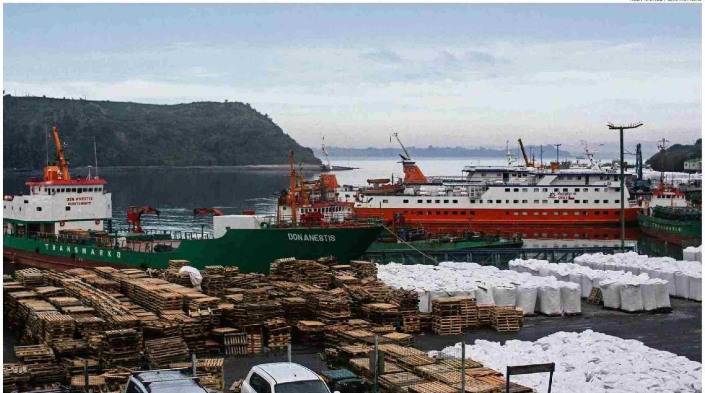
LOS REQUERIMIENTOS DE INSPECCIÓN MARÍTIMA SUPERAN LA CAPACIDAD DISPONIBLE DE LOS ENCARGADOS DE REALIZAR ESA TAREA, LO QUE GENERA INQUIETUD POR LOS EFECTOS EN EL NORMAL DESARROLLO DE LA ACTIVIDAD.