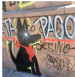
Durante el estallido, los murales del "perro Matapacos" se propagaron en las paredes del centro.

El artista visual licenciado en Estética,