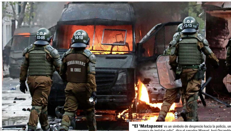
"El 'Matapacos' es un símbolo de desprecio hacia la policía, una manera de instalar odio", dice el senador Manuel José Ossandón.