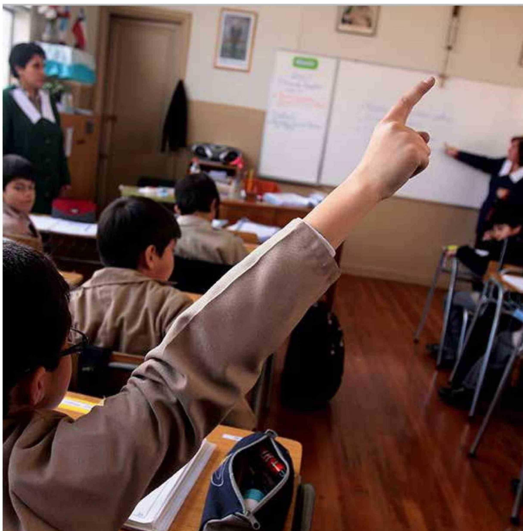
► Las subsecretarías trabajan codo a codo con el ministro de Educación.

nar como posible subsecretario, se aventuró con una columna llamada "Los desafíos del próximo gobierno en educación", lo que permite proyectar dónde podrían estar sus focos.