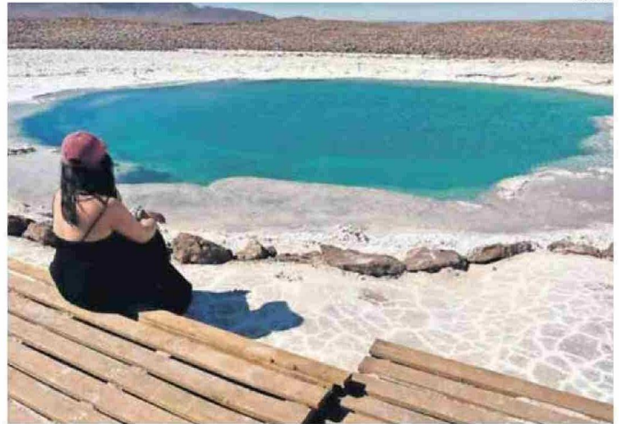
LOS MAJESTUOSOS SALARES Y LAGUNAS DEL DESIERTO DE ATACAMA SE DESATAN EN EL PORTAL DE VIAJE.