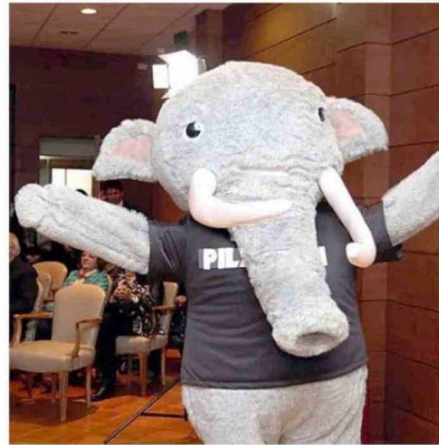
EL MUNICIPIO INCLUSO CREÓ “EL PILAUKÍN” PARA DESTACAR EL SITIO.

de la huella humana más antigua de América encontrada en el sitio Pilauco y que es exhibida en el Museo del Pleistoceno ubicado en el Parque Chuyaca.