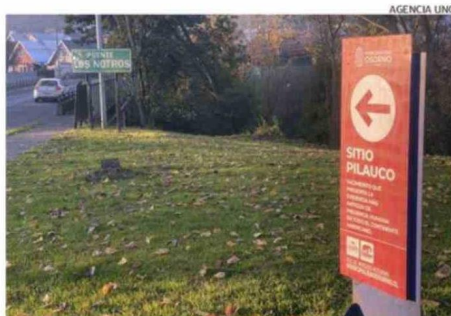
SE HA INSTALADO SEÑALÉTICA, PERO SIGUE SIENDO INSUFICIENTE.

Entre las iniciativas destaca el Modelo de Gestión del Paleoturismo, financiado a través de Corfo e implementado en toda la provincia mediante diversas líneas de acción ligadas al turismo, impulsadas desde el año 2013.