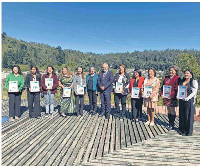
Diversidad en las áreas en las cuales se desarrollan representa el grupo elegido este año.