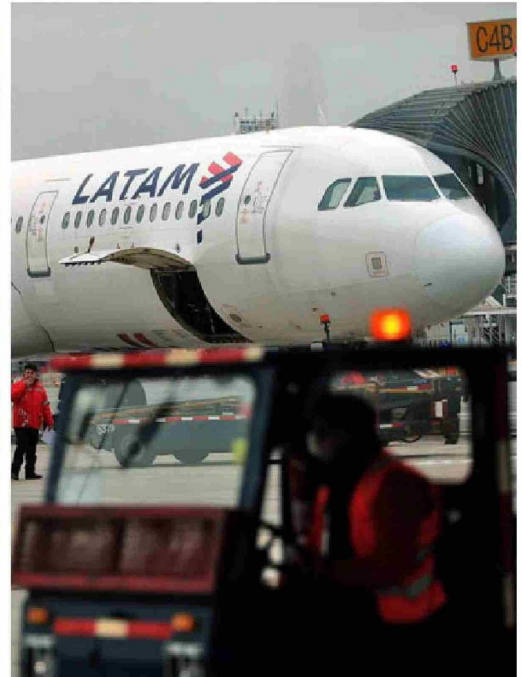
Latam registró ganancias por US$705 millones en los primeros nueve meses de 2024.

Otro es el caso de SQM. La minera no metálica reportó un desplome en sus ganancias de 72,58% año a año en el tercer trimestre, totalizando US$131,4 millones. Y en el período que va de enero a septiembre, el dato empeora: pasó de ganancias por US$1.809 millones a pérdidas por US$524 millones.