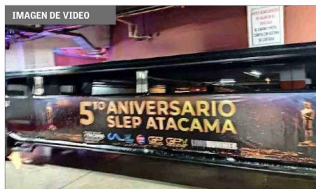
Una limusina Hummer personalizada con un cartel que indicaba “5º aniversario SLEP Atacama” se ocupó para el controvertido evento.

tras llegar al cargo, luego de que se conociera sobre la contratación de sus hijas. Una auditoría del Mineduc confirmó que se les pagaban sus sueldos con dineros de la Subvención General y la Subvención Escolar Preferencial, que no pueden destinarse a remuneraciones.