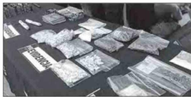
Cocaína, pasta base, marihuana y dinero en efectivo también fueron incautados durante los allanamientos.

dinación con el Ministerio Público. Lo que detectaron fue una red dispersa de puntos de venta de droga que operaban de manera independiente, pero con algo en común: todos mantenían armas para defender sus sectores. "No son dos bandas rivales, son distintos puntos independientes de venta de droga", explicó más tarde el prefecto inspector Guillermo Gálvez Carriel, je-