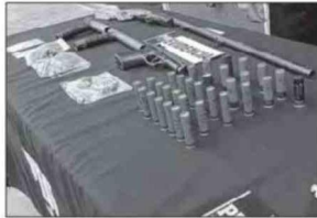
Explosivos, municiones y armamento incautado durante el megaoperativo de la PDI la madrugada de este miércoles.

Con esa información, equipos Microtráfico Cero (MT-0) de la PDI de Viña del Mar y Quillota comenzaron seguimientos y vigilancias en toda la zona, siempre en coor-