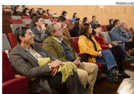
AUTORIDADES Y ESTUDIANTES ASISTIERON A LA ACTIVIDAD.