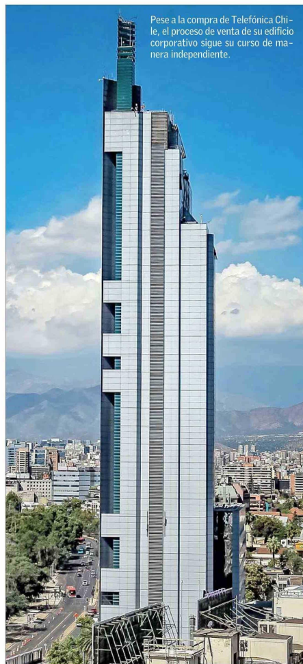
Pese a la compra de Telefónica Chile, el proceso de venta de su edificio corporativo sigue su curso de manera independiente.

Millicom opera en más de 10 países de la región bajo la marca Tigo. Esto incluye a Colombia, Ecuador y Uruguay, negocios que también fueron adquiridos a Telefónica en estos países durante el último año.