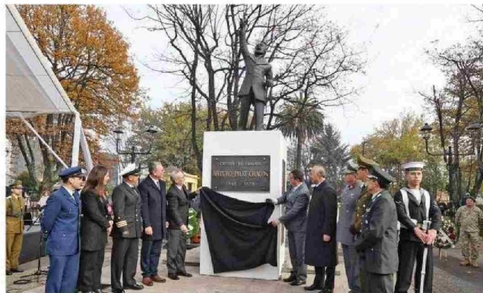
LAS AUTORIDADES DEVELAN LA PLACA DEL MONUMENTO A ARTURO PRAT, EN PLAZA TEODORO SCHMIDT.