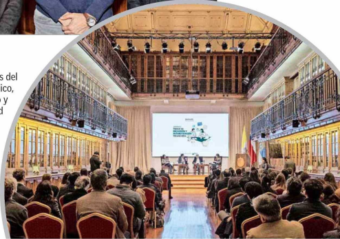
Representantes del ámbito académico, público, privado y de la sociedad civil asistieron a la presentación del estudio "Radiografía de la Educación e Inclusión Financiera en Chile".