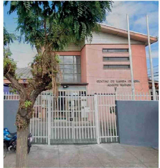
EL ELEAM DE HUALPÉN cuenta con identificación y seguimiento de residentes en riesgo de desorientación.