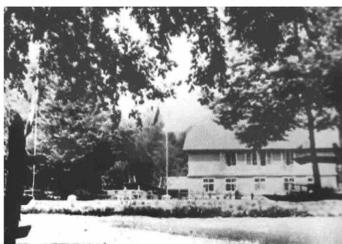
Vista del ingreso al Hotel de Vilches.