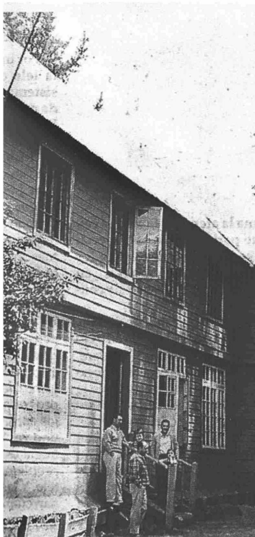
Fachada lateral del Hotel de Vilches Alto en la década del sesenta del siglo XX.