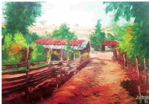
Paisaje de Vilches. Óleo del pintor talquino Claudio Hernández.