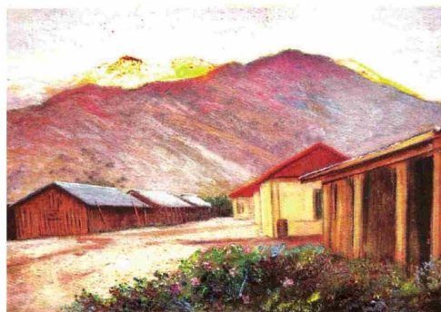
Casas del sector de Vilches, cerca del Hotel en que se realizó el VII Congreso de Arqueología de Chile en 1977. Museo O' Higginsiano y de Bellas Artes de Talca.