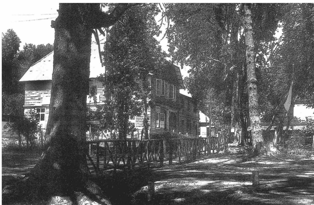
Vista del Hotel en la década del sesenta del siglo pasado.

Construido en 1931, mantuvo su apogeo durante tres décadas, desde la del cincuenta hasta la del setenta del siglo pasado, iniciando después un período de olvido y decadencia, hasta que un incendio lo consumió en 2003