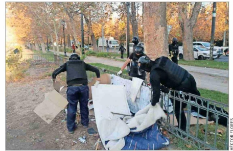
BASURA.— Vecinos consultados ayer en la zona del parque Forestal coincidieron en criticar las condiciones de aseo que presenta el lugar.

Eran puros adultos mayores que necesitaban su trabajo. Ahora, el parque está súper cochino, hay mugre por todos lados. Tampoco nadie saca las ramas", describe. "A mí esto nadie me lo cuen-