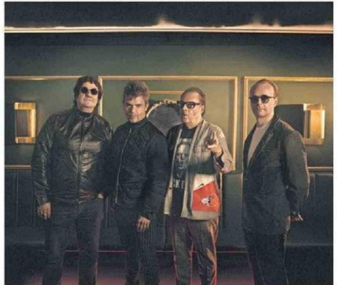
La formación original no lanzaba discos desde agosto de 1999.

El disco contó con Álvaro Henríquez como productor principal,