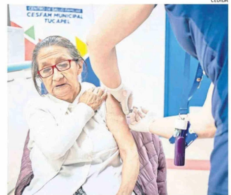
SE BUSCA AUMENTAR LA CANTIDAD DE VACUNADOS