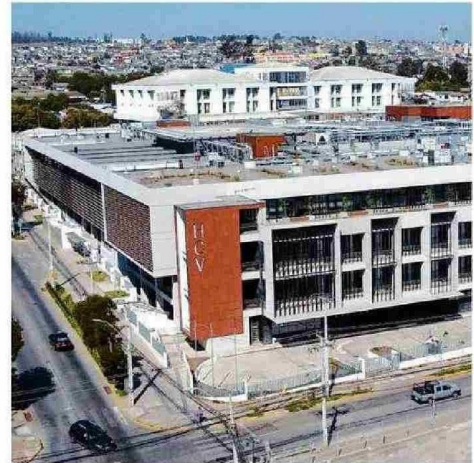
LOS CUATRO GREMIOS DEL HOSPITAL EXIGEN RESPUESTAS A LA DIRECCIÓN.

“ Ante la ausencia de respuestas a nivel local hemos debido escalar esta situación a instancias superiores”,