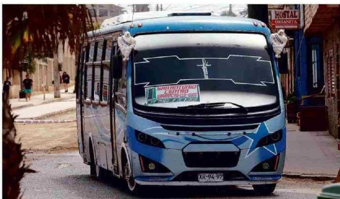
LOS MICROBUSES TAMBIÉN MIDEN EL PULSO DEL VERANO EN EL LITORAL CENTRAL.