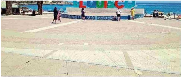
DE LA ACTIVIDAD TURÍSTICA EN EL QUISCO ES NOTORIA.

go, el escenario abruptamente an-lesalojo fijado para enero. "Eso desin- a los turistas", afir-