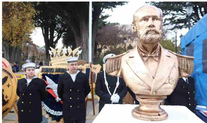
Con el busto del Capitán Arturo Prat se conmemora a las Glorias Navales en Punta Arenas.

En la Plaza de Armas Benjamín Muñoz Gamero en Punta Arenas