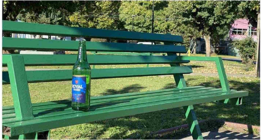
EN LAS MAÑANAS ES COMÚN VER BOTELLAS Y CAJAS DE VINO QUE QUEDAN DE LA NOCHE ANTERIOR.

de áreas verdes por habitante tiene la comuna. Es de las que cuenta con mejor accesibilidad de la comunidad en la región y de las primeras a nivel nacional.