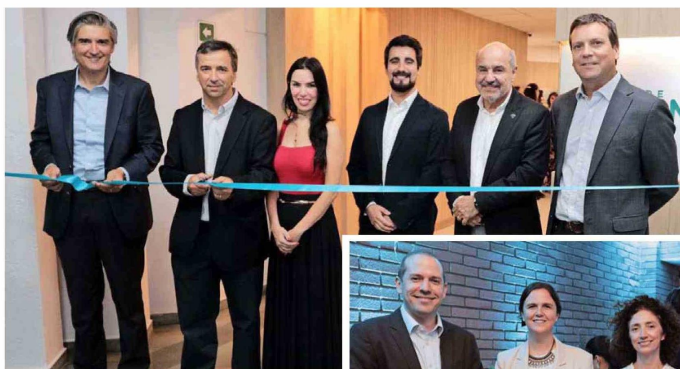
Representantes de RedSalud, en la apertura del nuevo Centro de Salud Mayor, el cual iniciará sus atenciones durante el mes de enero, en Clínica RedSalud Vitacura.