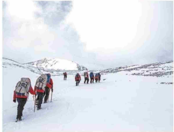
En esta foto de Inach se puede ver la majestuosidad del glaciar Unión que, como muchos, está en peligro.