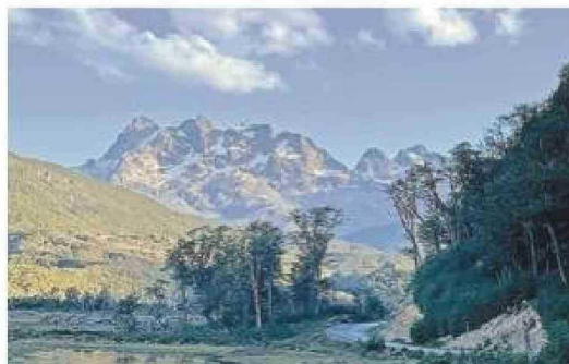
El Plan de Acción propone declarar la Ruta Y-85 como "escénica-patrimonial", dentro del ámbito de las áreas protegidas de la extensa comuna de Timaukel.

Una parte relevante de las acciones ya se encuentran en ejecución o han sido iniciadas por el municipio y más de treinta se