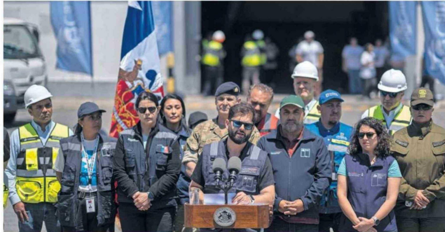
EN LA REGIÓN DEL BIOBÍO YA SE HAN CURSADO CERCA DE 2.200 BONOS.

En lo estrictamente económico, el Ejecutivo puso sobre la mesa cifras concretas para mitigar el impacto en las familias