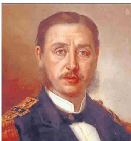
CAPITÁN DE LA GOLETA ARTILLADA COVADONGA, CARLOS CONDELL DE LA HAZA.