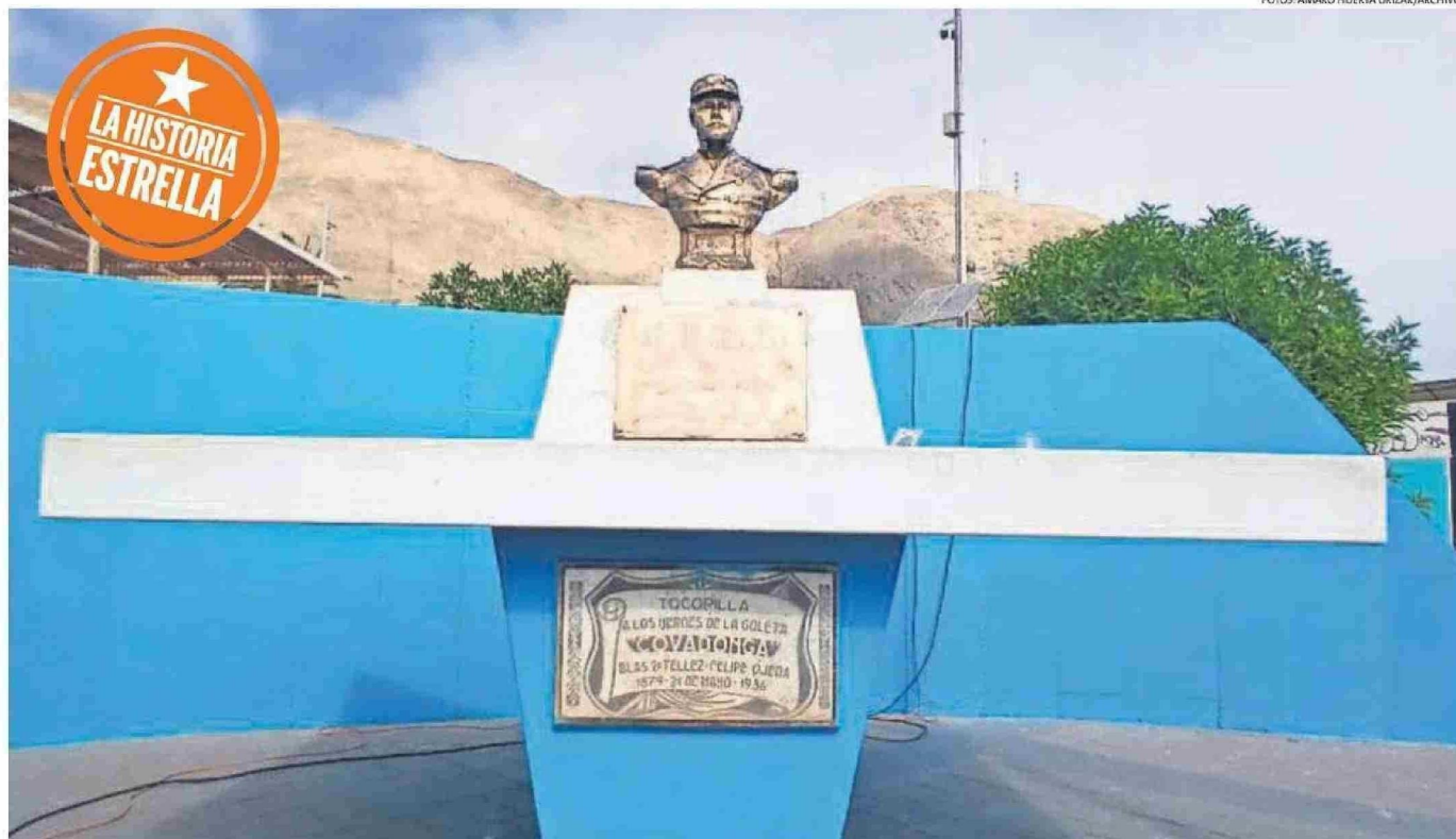
SEPULTURA DE LOS MARINOS DE LA COVADONGA, UBICADA BAJO UN BUSTO DEL CAPITÁN CARLOS CONDELL EN LA PLAZA PRINCIPAL DEL PUERTO SALITRERO, DONDE DESCANSAN DESDE 1936.