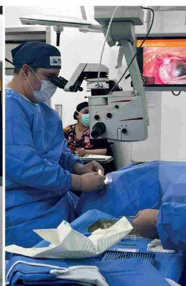
REGISTRO DE LA PRIMERA CIRUGÍA OFTALMOLÓGICA con injerto de membrana amniótica desarrollada en el CAVRR.

tienen mayor exposición solar y más dificultad para acceder a tratamientos especializados", indicó el especialista.