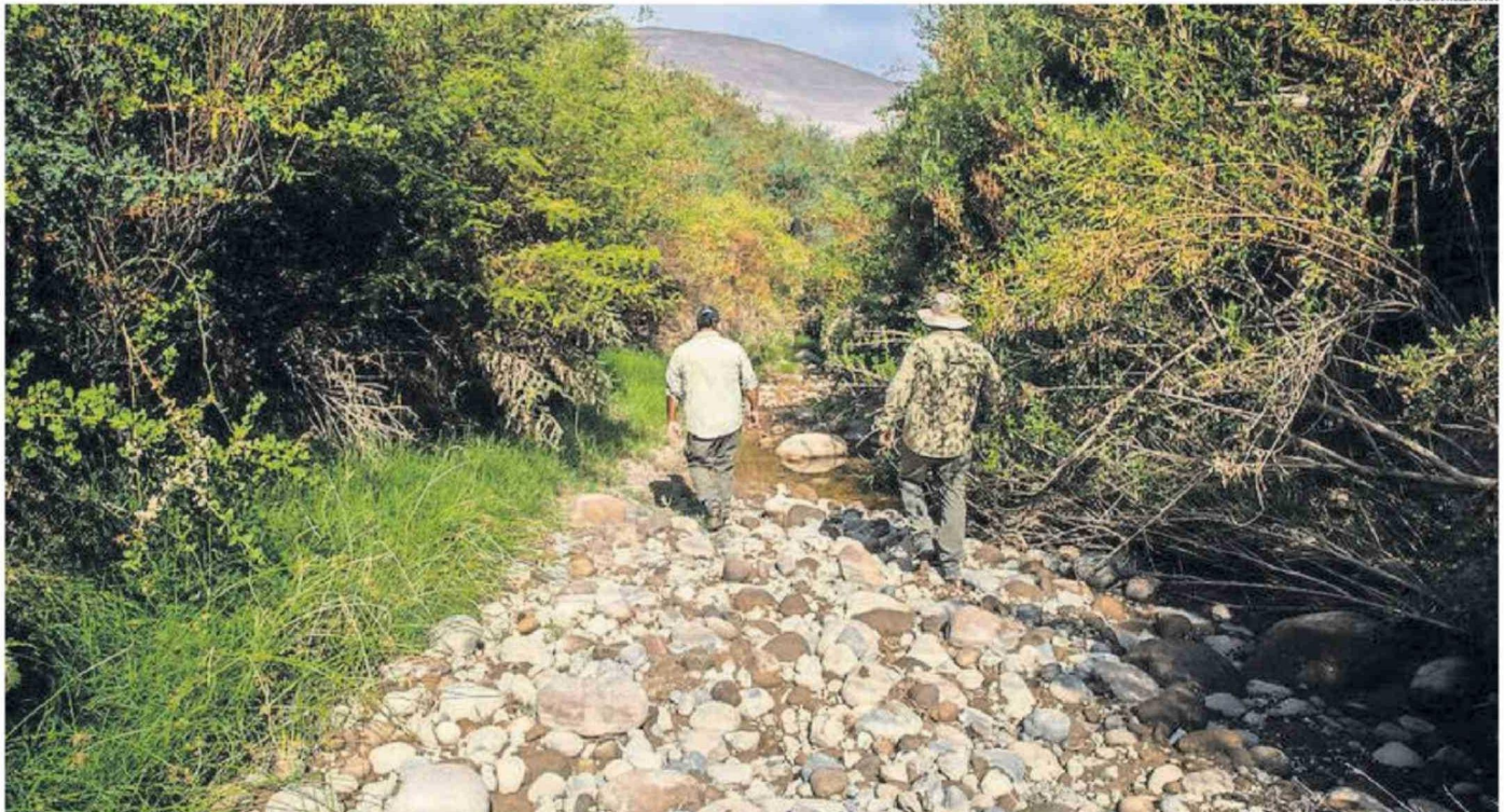
AUTORIDADES Y EXPERTOS ADVIERTEN UNA DISMINUCIÓN EN LA PRESENCIA DE LA ESPECIE EN EL VALLE DE CHACA, ENCENDIENDO ALERTAS SOBRE SU ESTADO DE CONSERVACIÓN.