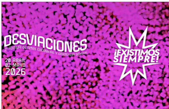
La polémica reaviva el debate del verano, cuando se conoció el financiamiento público a festival de cine pornográfico que tuvo lugar en Valparaíso.

Bajo nombres como "Práctica de culos" o "Beso Marika en Jauría de Perros", performances se exhibirán en centros culturales y municipales de cinco comunas de la RM. Alcaldes desmienten de que se trate de pornografía y acusan "censura".