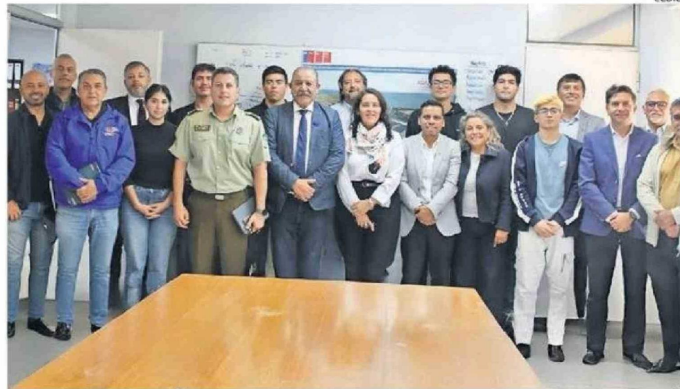
AUTORIDADES REGIONALES, MUNICIPIO Y COMUNIDAD UNIVERSITARIA SE REUNIERON AYER.

En este contexto, las autoridades acordaron impulsar la conformación de una mesa de trabajo intersectorial, orientada a establecer un convenio de carácter tripartito que defina