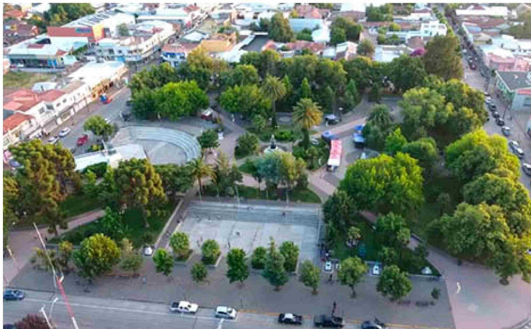
Con cinco indicadores en el rango Bajo, San Carlos es la comuna peor evaluada de Ñuble.

La comuna se ubica en la clasificación "Medio bajo" en Conectividad y transportes y Condiciones socio-culturales; y "Bajo" en Salud y medio ambiente.